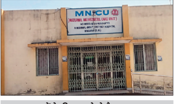
बच्चों के लिए पहले से है व्यवस्था बीमार या संक्रमित बच्चों के उपचार के लिए एमसीएच में पहले से ही व्यवस्था है। यहां 20 बेड का स्पेशल न्यू बॉन केयर यूनिट एमएनसीयू बनाया गया है। जिसमें बच्चों का इलाज किया जाता है। यहां कमी थी तो सिर्फ एमएनसीयू की, लेकिन इसके बगल में अब यह समस्या भी दूर हो गई, लेकिन वर्तमान में यह यूनिट बंद है।

मातृ शिशु अस्पताल एमसीएच में 38 लाख रुपए की लागत से बना 30 बेड का न्यू बॉन केयर यूनिट एमएनसीयू बीते दो माह से शो-पीस बनकर रह गया है। जिससे गर्भवती माताओं में संक्रमण का खतरा मंडरा रहा है। वार्ड में ड्रेनेज सिस्टम का काम चलने से ताला लटका हुआ है ऐसे में मजबूरन माताओं को एमसीएच में शिफ्ट कर दिया गया है। देखा जा रहा था कि कई बार जन्म के बाद माताओं के बीमार रहने से उनके बच्चों में संक्रमण का खतरा बढ़ जाता था। इसके अलावा गायनिक वार्ड में भर्ती अन्य महिलाओं व बच्चों के साथ भी ऐसी स्थिति निर्मित होती थी। इसके लिए शासन से फंड की मांग की गई थी और स्वीकृति भी मिल गई। इसके