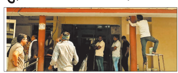
हरिभूमि न्यूज ►► रायगढ़

जमीनों के बाजार मूल्य में 9 सालों के बाद संशोधन नै रियल एस्टेट बाजार की पूरी दिशा बदल कर रख दी है। 20 नवंबर से लागू की गई गाइडलाइन दरों में शहरी और कस्बों की महंगी जमीनों की बिक्री पर स्पष्ट अस्तर डाला है। जिले में जमीनों की खरीदी बिक्री में गिरावट देखी गई। पंजीयन विभाग के आंकड़ों के मुताबिक नई दरों के लागू होने के बाद भी राजस्व में ज्यादा गिरावट दर्ज नहीं की गई है। इसका एक प्रमुख कारण ग्रामीण इलाकों में अभी भी जमीनों के सौदे बढ़ रहे हैं। पंजीयन विभाग से मिली जानकारी के मुताबिक शहरों की हाई वेल्यू जमीनों पर 15 से 40 प्रतिशत तक की वृद्धि दर्ज की गई है। इस वृद्धि ने बड़ी डीलस को धीमा कर दिया है। खरीदार फिलहाल नेट एंड वाच मोड पर है। वहीं ग्रामीण इलाकों की जमीनों पर मूल्यंकन अब वर्गमीटर की बजाए हेक्टेयर में होने से इन पर नए दरों का ज्यादा असर नहीं देखने को नहीं मिला है। इससे गांवों की जमीनें खरीददारों के लिए सुलभ और लाभकारी नजर आ रही है। डायवर्ट जमीनों पर पहले