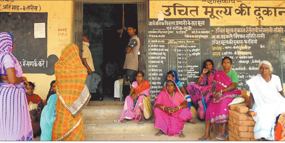
हरिभूमि न्यूज ►► रायगढ़

रायगढ़। जिले के करीब 70 फीसदी लोग आज भी सरकारी राशन के भरोसे अपना जीवन यापन कर रहे हैं। यह हम नहीं बल्कि खाद्य विभाग के आंकड़े कह रहे हैं। जनगणना में जनसंख्या के आंकड़े और बीपीएल कार्डधारियों के संख्या से यह अंतर साफ जाहिर होता है। जिले में वर्तमान में 7 लाख 61 हजार से अधिक लोग बीपीएल कार्डधारी हैं। कार्ड में बनाने में नियमों का नहीं पालन नहीं होने की वजह से इस तरह के हालात निर्मित होने की बात कही जा रही है। हालांकि अभी छंटनी हो रही है। ऐसे में यह संख्या कम होगी या बढ़ेगी जांच के बाद ही सामने आएगा। 2011 की जनगणना के अनुसार जिले की कुल आबादी 11 लाख